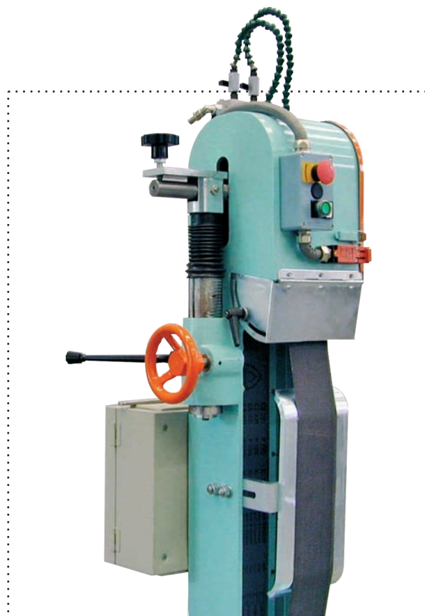
Lavorazione su piano

Machines conforming to the essential safety and quality requirements provided by the Machinery Directive 2006/42/CE