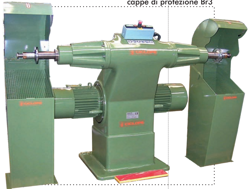
Antares 613 cappe di protezione Br3