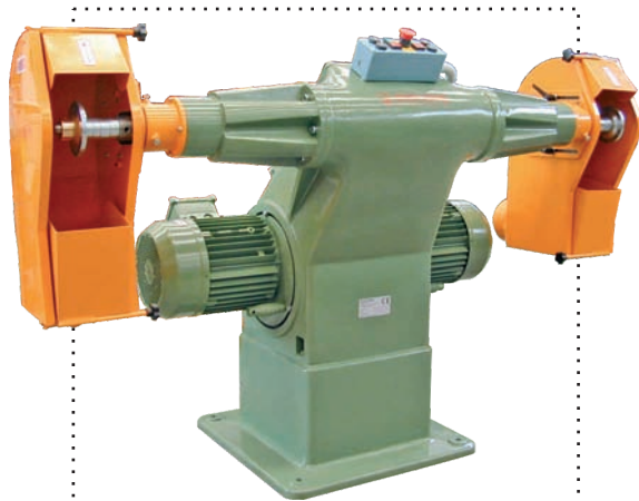
Antares 315 Mv cuffie di protezione regolabili speciali