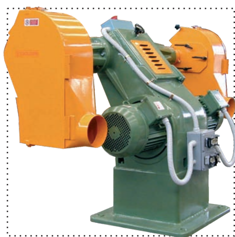
Antares 315 Mv cuffie di protezione speciali regolabili